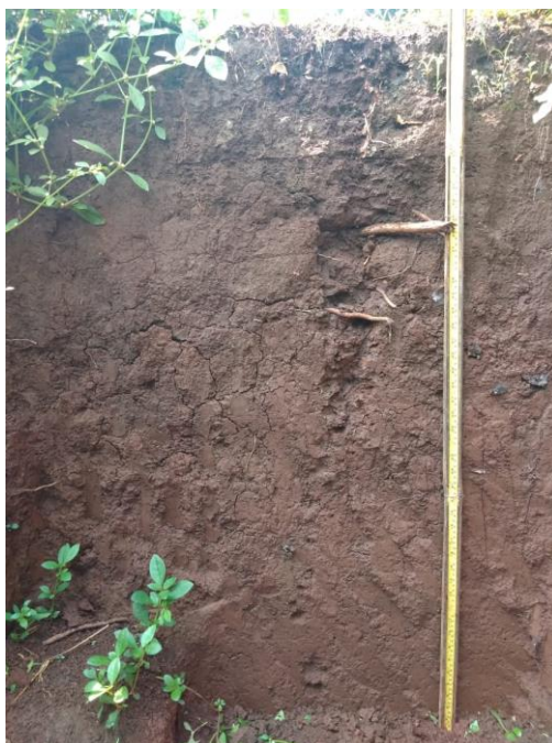
Gambar 2. Profil Tanah di Lokasi Penelitian

Pengamatan sifat morfologi lainnya seperti konsistensi, struktur menunjukkan adanya perkembangan, walaupun belum mencapai tingkat perkembangan lanjut. Konsistensi didominasi oleh konsistensi teguh sedangkan pada permukaan tanah memiliki konsistensi gembur. Hal ini karena adanya pengolahan tanah, yang mana lokasi penelitian merupakan lahan ladang yang ditanami tanaman jagung. Bentuk struktur dari sub angular blocky (sbk) sampai angular blocky (abk), tingkat kemantapan agregatnya menunjukkan pada tingkatan lemah sampai cukup, artinya bahwa tanah tersebut merupakan tanah yang berkembang. Tingkat perkembangan struktur tanah ditentukan berdasarkan kemantapan bentuk struktur tersebut terhadap tekanan (Meli et al. , 2018). Sifat morfologi tanah yang diamati di lapangan, terdapat pada Tabel 1.