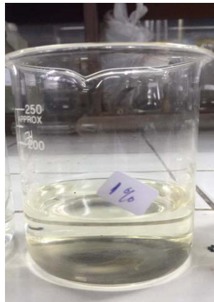
Gambar 1. Hasil aqueous stability (surfaktan SLS konsentrasi 1%)

Dalam penelitian ini yang di dapatkan ada beberapa hasil yang dijelaskan dengan beberapa tahap yaitu aqueous stability , IFT/CMC, sifat fisik batuan reservoir, dan terakhir coreflooding .