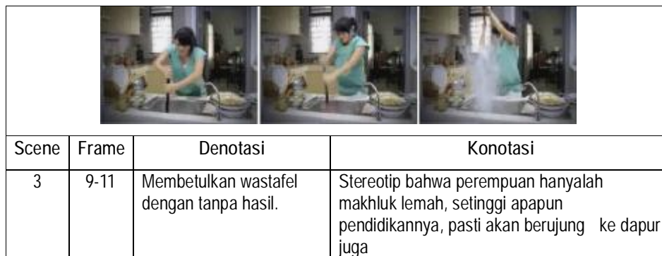
Gambar 3. Scene tentang seorang ibu rumah tangga membetulkan Wastafel