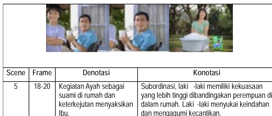
Gambar 5. Scene tentang seorang ayah dan anak yang menyaksikan ibu mencuci.

setara ketika diperlihatkan bagaimana kenyamanan yang didapatkan oleh seorang ayah atau laki-laki di pagi, dengan duduk bersantai di teras rumah sambil membaca koran dan meminum kopi, sedangkan seorang ibu atau perempuan digambarkan berturut-turut melakukan pekerjaan rumah dari pekerjaan yang berat hingga yang ringan.