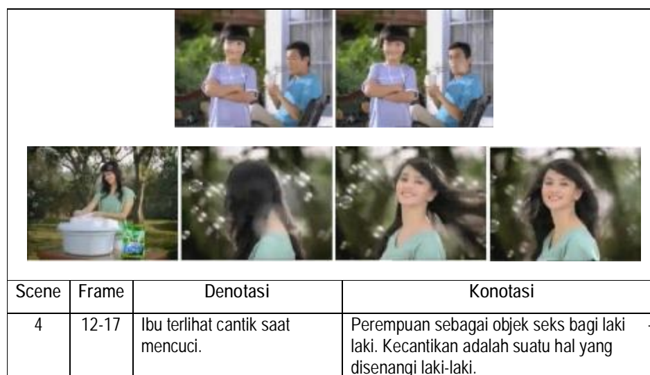
Gambar 4. Scene tentang seorang ibu mencuci terlihat cantik oleh suami dan anak.