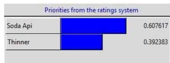
Gambar 4 Hasil Rating Alternatif

Setelah mendapatkan bobot kriteria, maka kita akan meminta para expert untuk melakukan penilaian kepada kedua alternatif tersebut, berikut merupakan hasil bentuk rating prioritas menggunakan Software Super Decisions yang kami peroleh dari para expert tersebut: