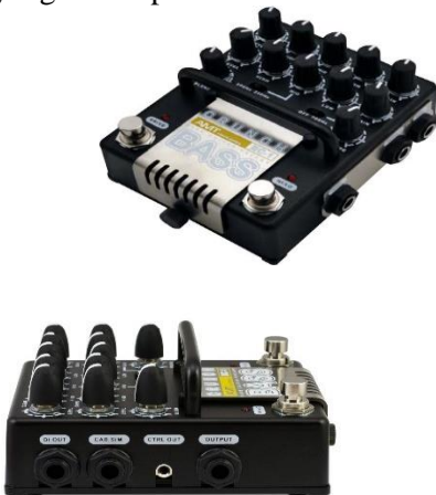
Gambar 4.1 Body kit preamplifier gitar bass elektrik yang ada di pasaran

Berdasarkan hasil evaluasi pemilihan alternatif yang didapat, bahwa alternatif 1 adalah pilihan terbaik menurut konsumen. Maka desain alat terdahulu mengalami beberapa perubahan, antar lain pada tombol kontrol dan tata letak posisi kontrol ukuran alat, bobot alat, serta kemudahan pengoperasian alat preamplifier gitar bass elektrik. Berikut gambar preamplifier yang ada di pasaran.