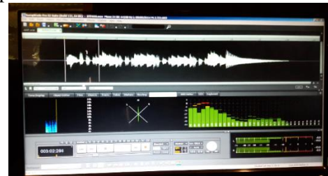
Gambar 4.4 Performansi Alat Rancangan Baru

Selain penilaian secara lisan, beliau juga melakukan pengujian dengan menggunakan software audio . Dapat dilihat dari performansi alat dari software audio dapat dilihat pada Gambar 4.4 dan 4.5.