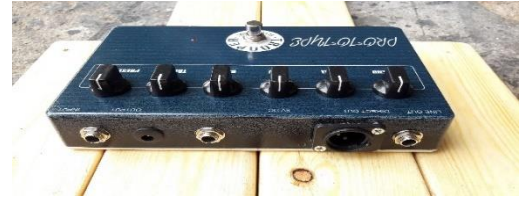
Gambar 4.2 Body kit preamplifier gitar bass elektrik hasil rancangan

Setelah melalui beberapa tahapan perancangan alat dan perubahan komponen, bahwa body kit preamplifier dioperasikan dari susunan knob tidak terlalu banyak tapi cukup dan sangat berguna bagi penggunaanya, ukuran tulisan pada knob mudah di lihat dari jarak pandang satu sampai tiga meter, tampilan lebih menarik dan bahan yang dipakai kuat akan tetapi memiliki bobot yang cukup ringan, dan memiliki karakter suara yang lebih luas serta lebih bagus. Gambar hasil rancangan perangkat preamplifier gitar bass elektrik dengan desain baru dapat dilihat pada Gambar 4.2.