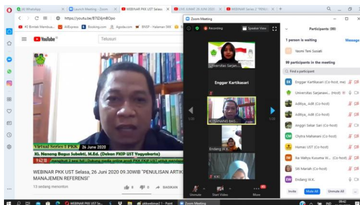
Gambar 2. Sambutan dari Dekan FKIP UST Yogyakarta

Peningkatan Kualitas Publikasi Ilmiah Melalui Pelatihan dan Pendampingan Penyusunan Artikel di Kalangan Mahasiswa melalui virtual Zoom. Sasaran kegiatan ini adalah kalangan mahasiswa. Kegiatan Abdimas dilaksanakan pada hari jumat, 26 Juni 2020, jam 09.30-selesai secara daring/online dengan 2 narasumber . Kegiatan ini diikuti oleh 480 peserta yang tidak hanya terdiri dari mahasiswa Prodi PKK, tetapi juga dari beberapa mahasiswa dari perguruan tinggi lain, selain itu juga diikuti oleh guru, Dosen dan alumni KAPPETEKAS. Kegiatan ini dilaksanakan secara daring/ online melalui media via aplikasi zoom dan live streaming di 3 kanal youtube yaitu: 1) Kanal Youtube UST : https://youtu.be/B7IZ4jmB0po 2) Kanal Youtube FKIP : https://youtu.be/hxy7rK0078Y ,3) Kanal Youtube Prodi.PKK UST : https://youtu.be/tjUumg90mCU . Partisipasi peserta dapat dilihat pada gambar 2 dan 3 berikut ini: