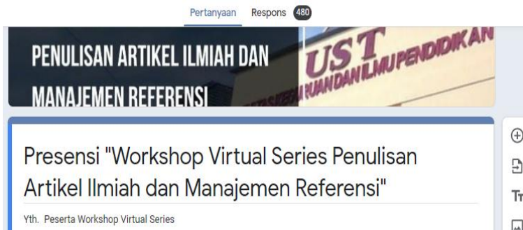
Gambar 1. Tampilan Google Form