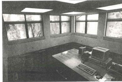
Gambar 9. Suatu ruang dengan jendela yang terbuat dari kaca dan tidak dilengkapi dengan ventilasi udara

Berdasarkan penelitian tersebut didapatkan hasil bahwa suhu ruang pada gambar 8 lebih rendah daripada suhu ruang pada gambar 9. Suhu ruang yang lebih rendah tersebut akan berpengaruh pada suasana kerja yang dirasakan oleh para pekerja. Suasana yang lebih nyaman akan membuat para karyawan menjadi lebih cocok dan bersemangat dalam bekerja sehingga produktivitasnya akan meningkat.