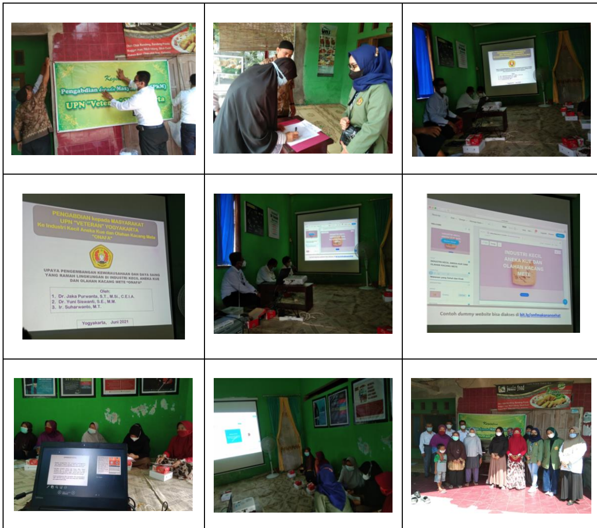
Gambar 7. Dokumentasi pelaksanaan Pengabdian bagi Masyarakat (Sumber: Data primer, 2021)

Dokumentasi terkait pelaksanaan PbM tersebut adalah sebagai berikut: