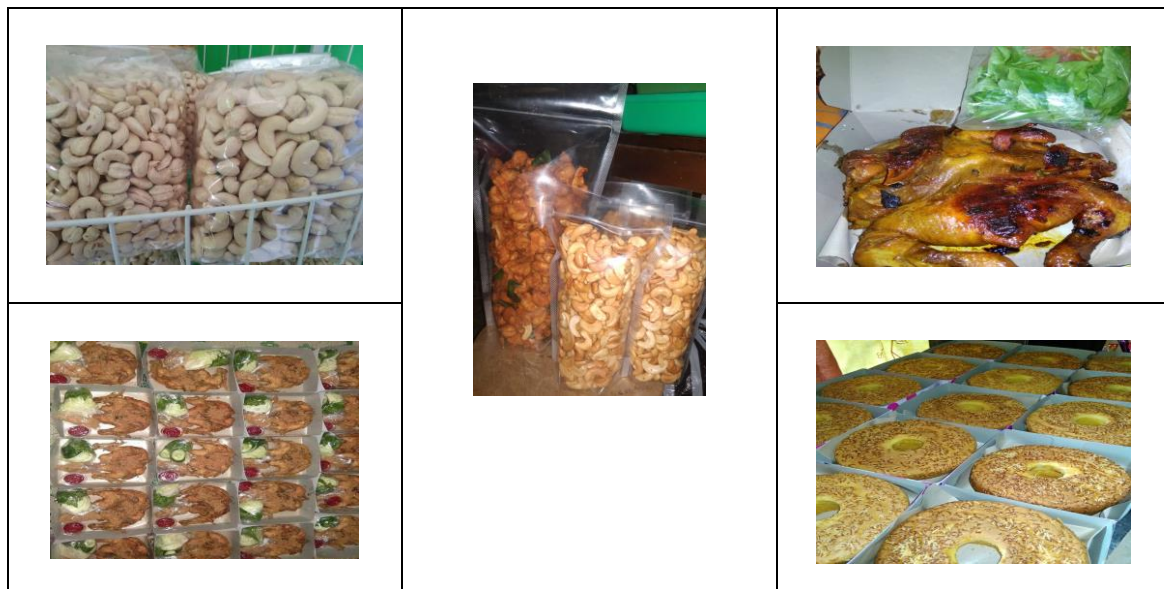
Gambar 4. Produk industri kecil “Onafa”

Pada perkembangan selanjutnya terjadinya wabah Covid-19. Pemerintah membuat peraturan agar selama masa pandemi, masyarakat hanya tinggal di rumah saja dan mengurangi kegiatan di luar rumah. Hal ini berdampak besar pada omzet penjualan Onafa. Pesanan menurun drastis, banyak kegiatan yang