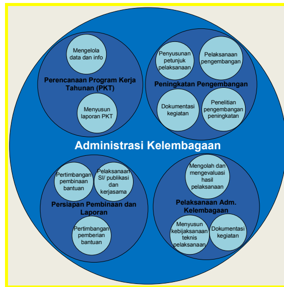
Gambar 1. Model Proses Administrasi Kelembagaan

Setelah proses bisnis yang mendukung bisnis telah diidentifikasi, langkah berikutnya adalah untuk mengidentifikasi dan mengklasifikasikan data yang dibuat, dikendalikan, dan digunakan oleh proses tersebut. Sebuah kelas data adalah kategori data yang berhubungan secara logis yang diperlukan untuk mendukung proses bisnis. Calon kelas data yang paling mudah diidentifikasi dengan bisnis yang terkait dengan sumber daya jenis data. Kelas data tersebut kemudian divalidasi menggunakan informasi input dan output dari proses bisnis. Melalui tiga langkah berikut: Identifikasi kelas data, menulis definisi kelas data dan memetakan kelas data yang terkait dengan proses.