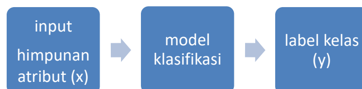
Gambar 2.1 Klasifikasi sebagai pemetaan input himpunan atribut x ke dalam kelas label y (Khomshah, 2016)

Klasifikasi adalah proses pembelajaran fungsi target f yang memetakan setiap sekumpulan himpunan atribut x ke dalam kelas label y yang belum diketahui sebelumnya seperti yang diilustrasikan Gambar 3.2.