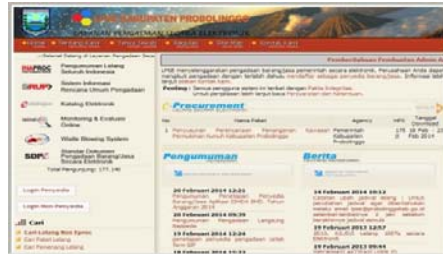
Gambar 1. Tampilan SPSE Kabupaten Probolinggo

Bank Dunia memberikan definisi berlapis tiga dari e-procurement dalam sektor Pemerintahan atau electronic-government procurement (e-GP) [2]. Pengadaan barang dan jasa Pemerintah secara elektronik ( e-procurement ) merupakan proses pengadaan barang dan jasa Pemerintah yang pelaksanaannya dilakukan secara elektronik yang berbasis Web/Internet dengan memanfaatkan fasilitas teknologi komunikasi dan informasi.