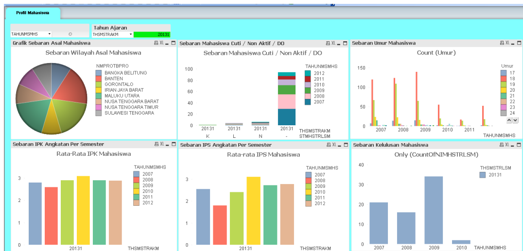
Gambar 3 Pada representasi data berdasarkan query yang dibangun menghasilkan 6 tampilan grafik yang saling terkait berdasarkan pada keadaan profil mahasiswa pada semester tertentu.

Hasil dari pemodelan query adalah representasi data yang mampu menggambarkan aktivitas profil mahasiswa dalam semester tertentu. Bagian ini dipergunakan untuk melakukan visualisasi data terhadap query yang telah dibangun pada tahap sebelumnya, adapun tampilan utama sistem A-INDEX sebagai berikut :