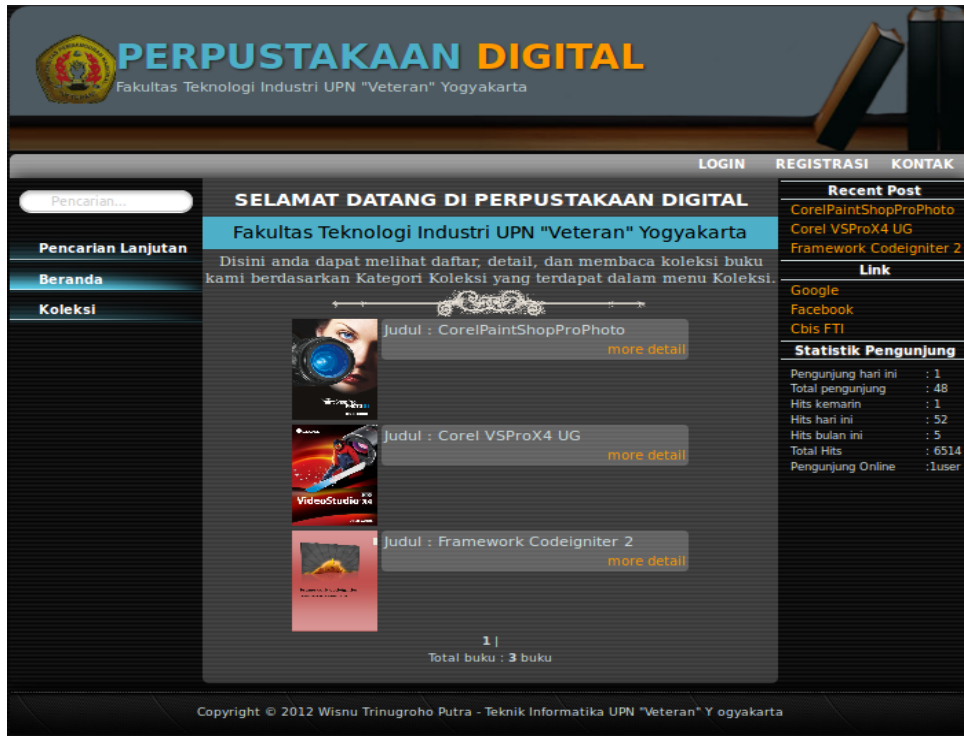
Gambar 4.1 Halaman Beranda

Listing program halaman beranda dapat dilihat pada modul di bawah ini :