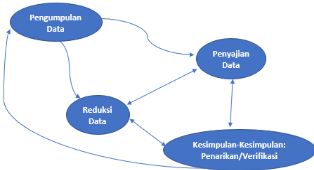
Gambar 2. Langkah penelitian

Analisis data kualitatif dilakukan secara terus menerus hingga mencapai titik jenuh dimana sudah tidak terdapat data baru lagi[14]. Demikian pula dengan penelitian ini dimana peneliti akan menganalisis secara berulang-ulang hingga tidak diperoleh lagi data baru. Tahapan analisis data pada penelitian ini dapat dilihat seperti pada Gambar 2 .