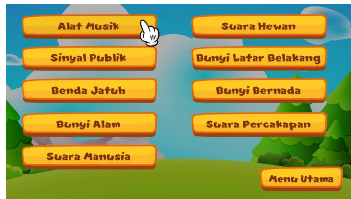
Gambar 4. Menu utama gim