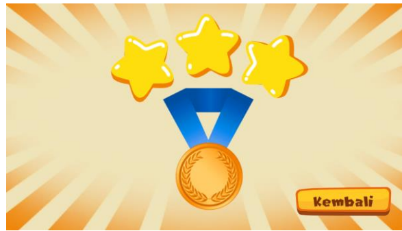
Gambar 5. Reward