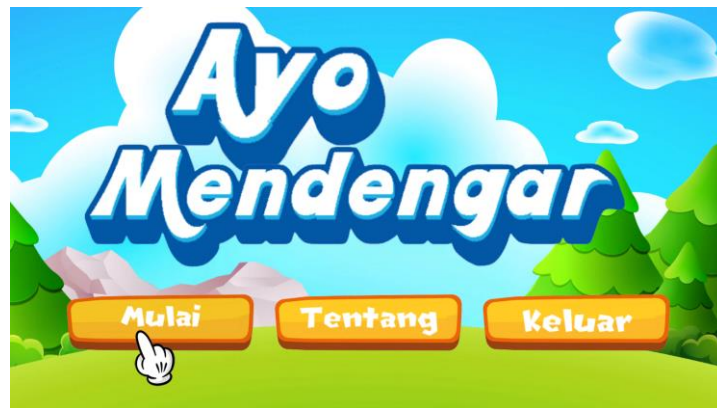
Gambar 3. Menu awal gim

Tampilan awal aplikasi gim pada perangkat laptop atau pc setelah aplikasi dibuka atau diinstal seperti yang tersaji pada Gambar 3 . Pada menu awal, terdapat 3 menu yaitu mulai, tentang gim, dan pengaturan. Apabila ingin memulai permainan maka tekan tombol mulai untuk masuk pada menu utama. Gambar 4 merupakan menu utama gim Ayo dengar. Diakhir permainan muncul reward berupa piagam apabila telah berhasil menyelesaikan semua misi seperti yang diperlihatkan pada Gambar 5 .