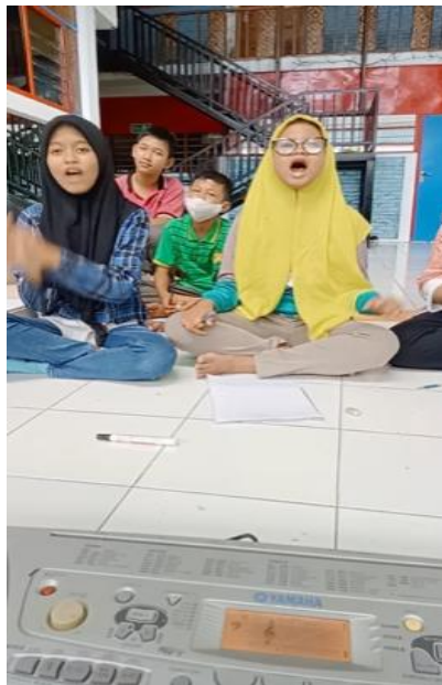
Gambar 2. Pembelajaran PKPBI menggunakan media keyboard

Pembelajaran PKBI yang dilakukan oleh guru selama ini menggunakan keyboard tersaji pada Gambar 2 . Berdasarkan hasil analisis konteks penggunaan diperoleh informasi yaitu sasaran gim serius idenifikasi bunyi yaitu anak tunarungu atau peserta didik kelas 3 dan 4 tingkat sekolah dasar yang sudah melewati proses pembelajaran deteksi bunyi dan diskrimisasi bunyi. Pengguna atau user dalam menggunakan aplikasi akan didampingi oleh guru. Proses pembelajaran PKBI dilakukan dengan metode klasikal sehingga dibutuhkan media pembelajaran yang dapat digunakan bersama-sama dan disesuaikan dengan kebutuhan perangkat yang tersedia di sekolah. Dengan demikian gim serius ini dikembangkan berbasis desktop atau PC, disertai perangkat pendukung seperti laptop, mouse, proyektor, dan layar.