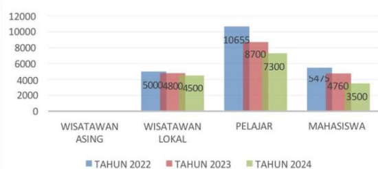
Gambar 1. Data Kunjungan Desa Wisata Ciderum

Dalam konteks tersebut, Desa Wisata Ciderum sebagai desa wisata edukasi masih menghadapi sejumlah tantangan. Berdasarkan hasil pra-survei dan wawancara dengan pengelola Desa Wisata Ciderum serta Kelompok Sadar Wisata (Pokdarwis), ditemukan permasalahan yakni dalam tiga tahun terakhir terjadi penurunan jumlah kunjungan wisatawan.