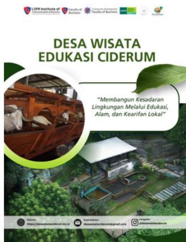
Gambar 2. Pembuatan E-Booklet Desa Wisata Edukasi Ciderum

E-booklet Desa Wisata Ciderum disusun sebagai media representasi visual dan narasi terpadu mengenai destinasi yang merangkum profil desa, potensi wisata alam dan budaya, serta nilai-nilai lokal yang menjadi keunggulan desa. Penyusunan e-booklet dilakukan melalui pengumpulan data lapangan pada saat pre-survei, dokumentasi oleh kelompok mahasiswa, dan proses wawancara dengan pokdarwis Desa Wisata Ciderum agar informasi yang disajikan bersifat informatif dan menarik bagi calon wisatawan maupun mitra kerja. E-booklet ini dirancang dalam format digital yang mudah diakses dan dapat digunakan sebagai bahan presentasi resmi oleh pengurus. Pembuatan E-Book Panduan