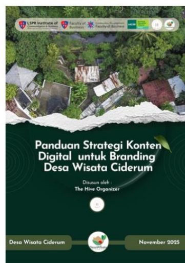
Gambar 3. Pembuatan E-Book Panduan Strategi Konten Digital Desa Wisata Edukasi Ciderum

Pada program GEMA terdapat penyusunan sebuah e-book panduan strategi konten dan branding yang dirancang sebagai modul pembelajaran praktis bagi pengelola desa wisata. E-book ini memuat materi tentang perencanaan kalender konten, teknik dasar pengambilan foto dan video, penguatan storytelling destinasi, serta pengelolaan identitas visual desa wisata. Penyusunan e-book ini dilakukan melalui proses perancangan materi, penulisan konten, desain visual, serta proses penyuntingan agar mudah dipahami oleh masyarakat. E-book ini diharapkan dapat menjadi rujukan jangka panjang bagi masyarakat dalam mengelola promosi digital secara mandiri.