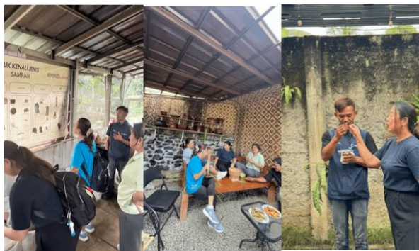
Gambar 6. Sosialisasi Uji Coba Pelaksanaan Paket Wisata Corporate

ini juga melambangkan proses pertukaran pengetahuan yang telah berlangsung selama seluruh rangkaian kegiatan GEMA, sekaligus menjadi bentuk dukungan terhadap keberlanjutan luaran program untuk pengelola desa wisata.