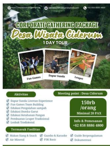
Gambar 4. Pembuatan Brosur Paket Wisata Corporate Desa Wisata Edukasi Ciderum