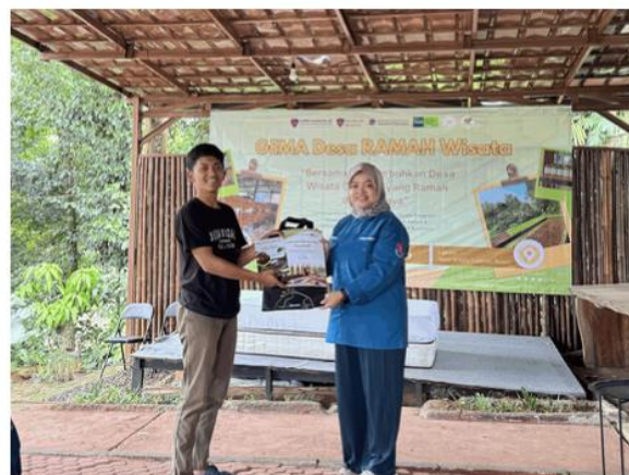
Gambar 5. Penyerahan E-Booklet Desa Wisata Ciderum secara simbolis

Pada hari pelaksanaan kegiatan uji coba paket wisata, dilakukan juga penyerahan simbolis E-Booklet Desa Wisata Ciderum yang telah disusun oleh kelompok peneliti. E-booklet ini memuat profil desa, penjelasan destinasi dan atraksi wisata, fasilitas pendukung, serta penawaran paket wisata yang tersedia, sehingga dapat dimanfaatkan sebagai media promosi dan bahan presentasi kepada calon wisatawan maupun instansi yang berpotensi menjalin kerja sama dengan Desa Wisata Ciderum di masa mendatang. Kegiatan penyerahan simbolis