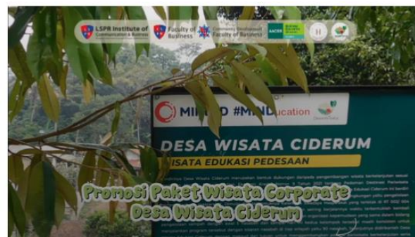
Gambar 7. Video Promosi Paket Wisata Corporate

Video promosi paket wisata korporat diproduksi oleh kelompok GEMA untuk menyajikan informasi dengan media audio-visual yang menarik, video ini meliputi rangkaian aktivitas wisata, interaksi peserta, serta keindahan Desa Wisata Ciderum selama pelaksanaan kegiatan. Proses pembuatan video meliputi pengambilan gambar di lapangan, penyusunan storyboard , hingga proses editing untuk menghasilkan video yang