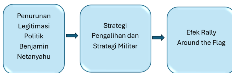
Gambar 1. Visualisasi Diagram Alur Penelitian

Kerangka pemikiran penelitian ini dibangun melalui sintesis antara Diversionary War Theory dan Rally Around the Flag Effect untuk menjelaskan hubungan antara krisis legitimasi domestik dan keputusan eskalasi militer Israel terhadap Iran pada Juni 2025. Berbeda dari pendekatan deskriptif, kerangka ini diposisikan sebagai model analisis yang menghubungkan variabel-variabel empiris secara sistematis, yaitu krisis legitimasi domestik sebagai variabel independen, konstruksi narasi ancaman sebagai variabel intervening , dan respons publik sebagai variabel dependen.