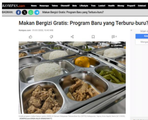
Gambar 1. Makan Bergizi Gratis: Program Baru yang Terburu-Buru

Berita dari Kompas.com di atas, secara garis besar Program Makan Bergizi Gratis yang diluncurkan pemerintah pada 6 Januari 2025 dengan anggaran Rp70 triliun per tahun menuai sorotan akibat kekurangan persiapan matang. Meski ditujukan untuk wilayah 3T yakni Terluar, Tertinggal, Terbelakang, implementasi justru dimulai di daerah perkotaan Jawa dengan alasan "kesiapan tata kelola". Kritik utama mencakup sistem sentralistik tanpa assessment pra-program, jangka waktu distribusi makanan yang berisiko kontaminasi karena tidak memenuhi standar