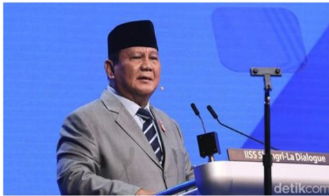
Prabowo Subianto - Foto: Prabowo Subianto di forum Shangri-La Dialogue 2024 di Singapura.

Samuel Gading - detikFinance Minggu, 30 Jun 2024 07:30 WIB