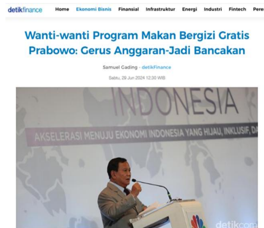
Gambar 6. Wanti-wanti Program Makan Bergizi Gratis Prabowo: Gerus Anggaran-Jadi Bancakan

Artikel berita yang berjudul "Wanti-wanti Program Makan Bergizi Gratis Prabowo: Gerus Anggaran-Jadi Bancakan" ditulis oleh Samuel Gading/Tim Redaksi Detikfinance, terbit 27 Juni 2024 pukul 12.30 WIB di Detikfinance (bagian dari Detik.com). Berita ini memperingatkan risiko pemborosan anggaran dan potensi korupsi dalam program makanan bergizi gratis Prabowo, menyerukan pengawasan ketat agar dana Rp71 triliun tak disalahgunakan.