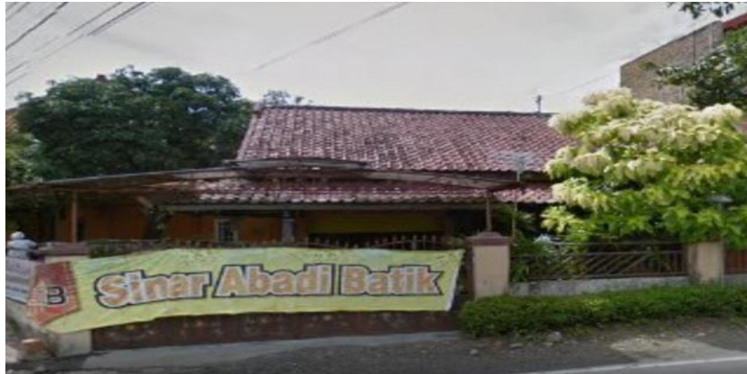
Gambar 2 Suasana Desa Bendungan Temon Wates ( http://www.catatannobi.com )

Secara geografis wilayahnya beragam mulai dari perbukitan hingga sungai-sungai. Sebagian besar wilayahnya masih berupa hutan dan lahan pertanian serta pegunungan sehingga tampak asri. Tiap-tiap daerah menyimpan potensi wilayahnya masing-masing mulai dari tempat wisata pantai dan wisata kuliner seperti makanan seafood, berbagai macam jenis ikan tangkapan nelayan di dekat pantai, ayam panggang, wedang uwuh, secang dan makanan tradisional lainnya. Juga terdapat banyak wisata alam seperti pantai glagah, pantai congot, pantai trisik, pantai bugel dan yang lainnya. Serta terdapat pengobatan tradisional, keindahan alam, berbagai macam jenis kerajinan bambu, kerajinan batik tulis, kerajinan tas rajut, sepatu rajut dan kerajinan lainnya, hingga terdapat wisata pantai yang sering menjadi tempat berkunjung masyarakat dari berbagai daerah lain untuk melakukan rekreasi bersama teman, keluarga dan kerabat dekat.