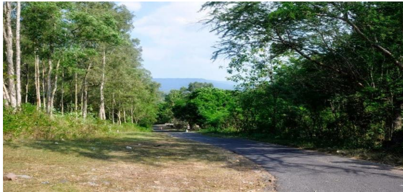
Gambar 1. Suasana Jalan di Desa Bendungan Kecamatan Temon Kabupaten Kulon Progo

Gambar foto di bawah ini menunjukkan tentang keadaan mitra di Desa Bendungan Kecamatan Temon Kabupaten Kulon Progo.