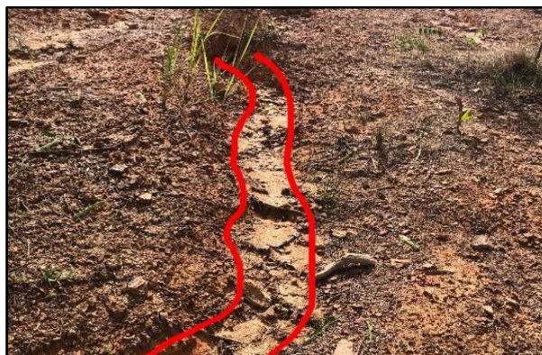
Gambar 2. Erosi Alur di Area Reklamasi