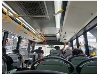
Gambar 1 Dokumentasi Observasi Transportasi Trans Jatim di Malang Raya